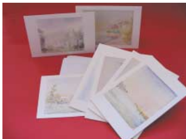
► SERIE "VENEZIA"

Siamo a disposizione anche per la sola visione. Per una personalizzazione dei biglietti augurali occorre prendere degli accordi. La spesa potrà essere concordata a seconda del numero dei biglietti.