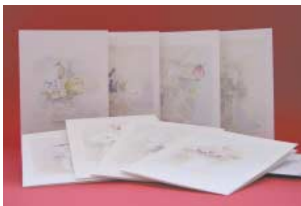
► SERIE FLOREALE