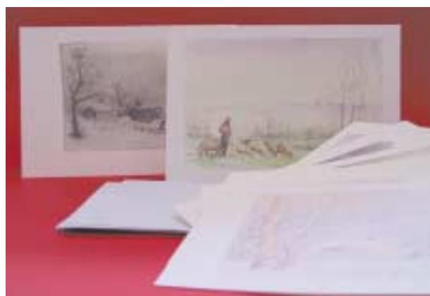
► SERIE NATALIZIA